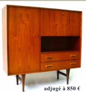
adjugé à 850 €

Et si avant de vendre par vous-même et de commettre des erreurs, vous profitez de nos expertises gratuites, des solutions que nous pouvons vous apporter afin de gérer en toute quiétude et au mieux de vos intérêts, la vente de vos objets et meubles, successions, plein contenu de vos maisons et appartements à vider.