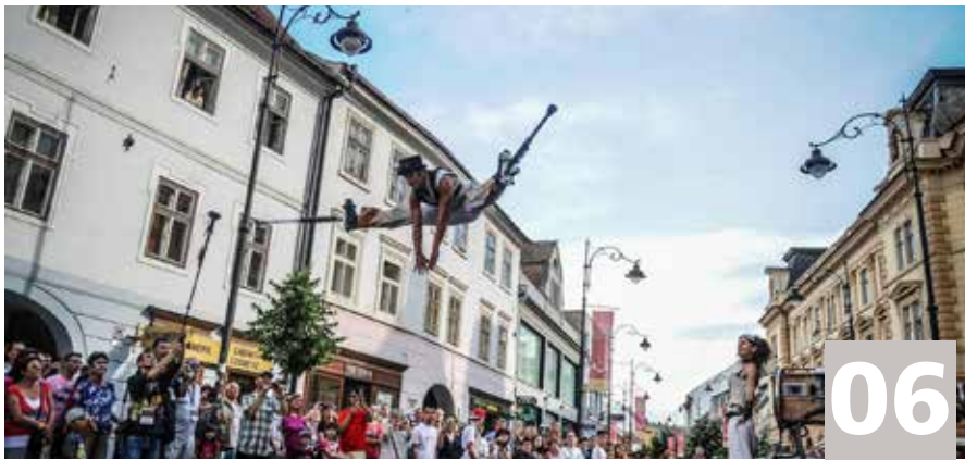
Fête des Fleurs / Bloemenfeest