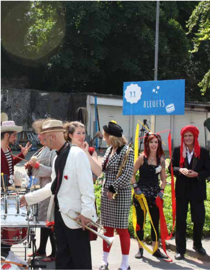
Take Off (Cie Tac O Tac) om 16.15 uur en 19.15 uur