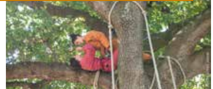
Fallen Thoughts (studio Éclipse) om 21.15 uur

› Twee wezens vallen, de ene na de andere van de takken. Het ene moment kleven ze als gekko's tegen de stam, het volgende moment hangen ze doodstil en onbeweeglijk als vleermuizen aan de takken.