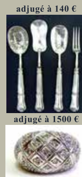
adjugé à 140 €