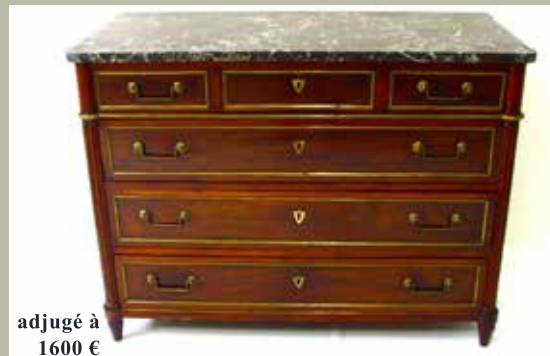
adjugé à 1600 €