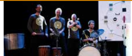
Sysmo Game , om 22.30 uur

› Sysmo Game is een... actiespel! Een spel dat het publiek meesleept in een avontuur dat tot doel heeft iedereen in beweging te krijgen, zoveel mogelijk energie op te laden en die aan mekaar door te geven. Doel van dit spel is een collectieve, volledig geïmproviseerde choreografie van 10 minuten te maken.