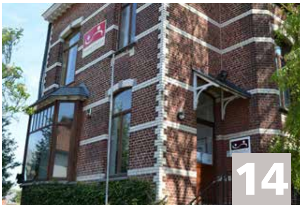
Le Planning familial Algemeen Welzijnswerk: