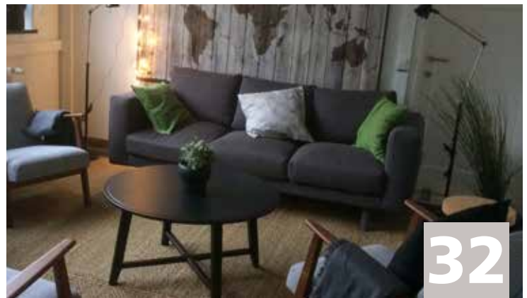
La Maison de l'Emploi Het Huis van het Werk