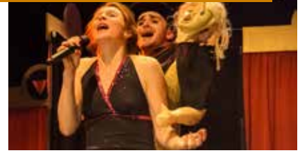
Venusberg (Pop cabaret – Cie Ah mon Amour!) om 20 uur

› Venusberg vertelt hoe een muzikante, een vrouw van het theater met een ontvlambaar karakter, en een man der letteren, een beeldend kunstenaar met een lichte neiging tot perversiteit mekaar ontmoeten. Een volledig krankzinnig muziekstuk