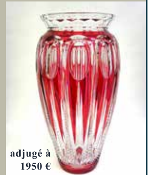
adjugé à 1950 €

QUAI AU BOIS DE CONSTRUCTION, 6, 1000 BRUXELLES TIMMERHOUTKAAI, 6, 1000 BRUSSEL Tél : 02 219 92 99 | info@sdvabc.com | www.sdvabc.com