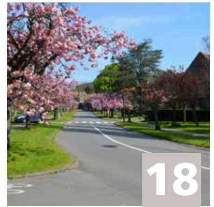
Avenue G. Benoidtlaan